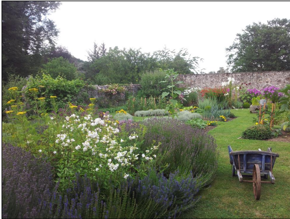
Massif de simples