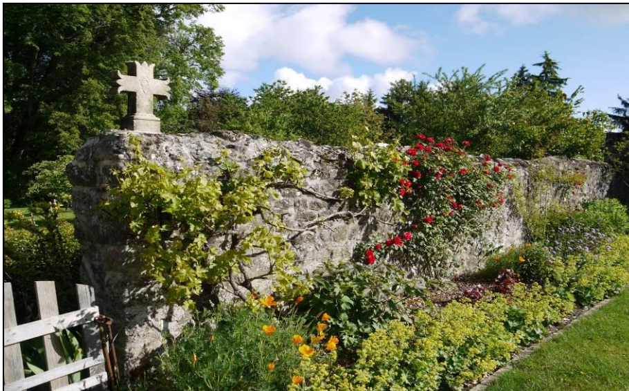
Entrée du jardin de curé et sa croix

Un petit jardin de curé est adossé au chevet de la chapelle Saint-Guillaume. Des carrés bordés de vieux pavés sont plantés de légumes, entourés de platebandes de fleurs vivaces à couper dont la floraison se renouvelle tout l'été. Les simples et herbes aromatiques ne sont pas oubliés. Des choux de Magnat, espèce rare rapportée du potager du Tsar de Russie à Saint-Pétersbourg au XVIII e par le marquis de Lestrang, ancêtre de la propriétaire, sont cultivés depuis 2017. Dans une pièce de la remise, une collection d'anciens outils de jardinage est exposée et dans l'autre, monsieur le curé a installé sa cuisine. Les oiseaux viennent se désaltérer dans l'auge en granit bordée de perovskias.