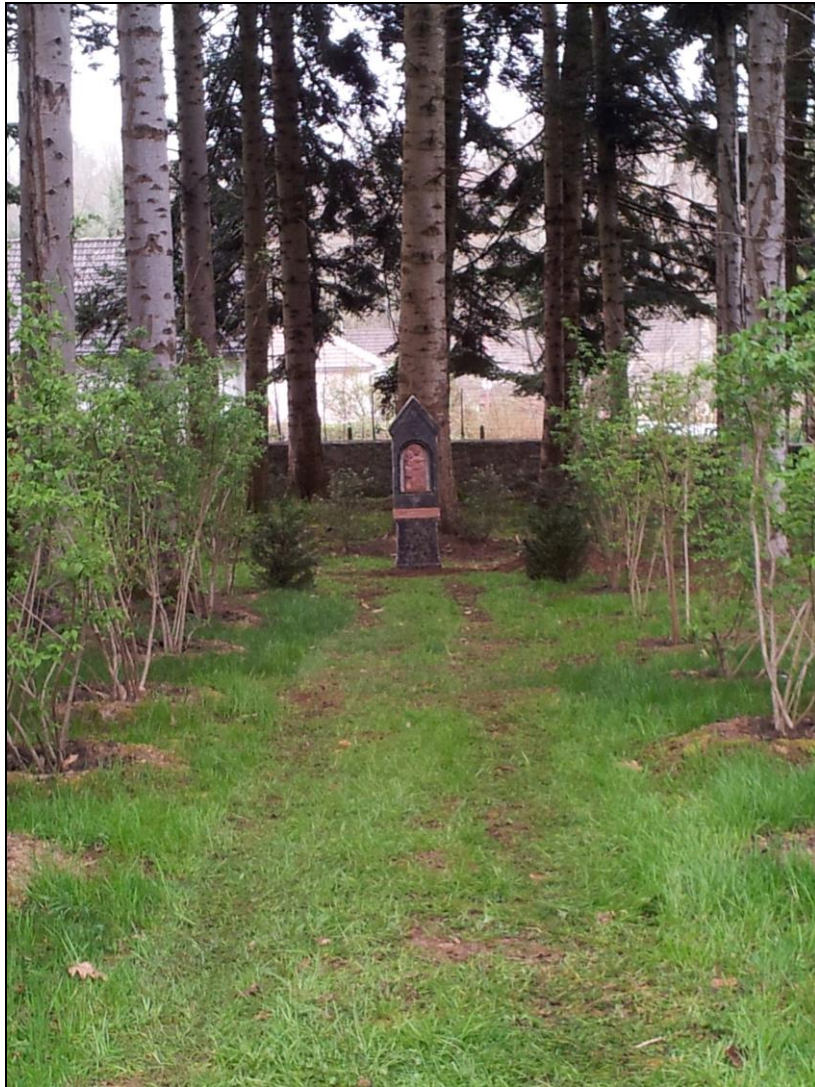
Clairière et oratoire Sainte-Anne

Le visiteur pénétrera ensuite dans la clairière romantique dominée par les fûts des sapins de Nordmann où s'élève un petit oratoire de pierre, dédié à sainte Anne, encerclé de viornes de Prague au bout d'une allée de chèvrefeuilles de Maack. La statue de sainte Anne a été sculptée en grès de Collonges-la-Rouge par Jacques de Verdal, artiste limousin.