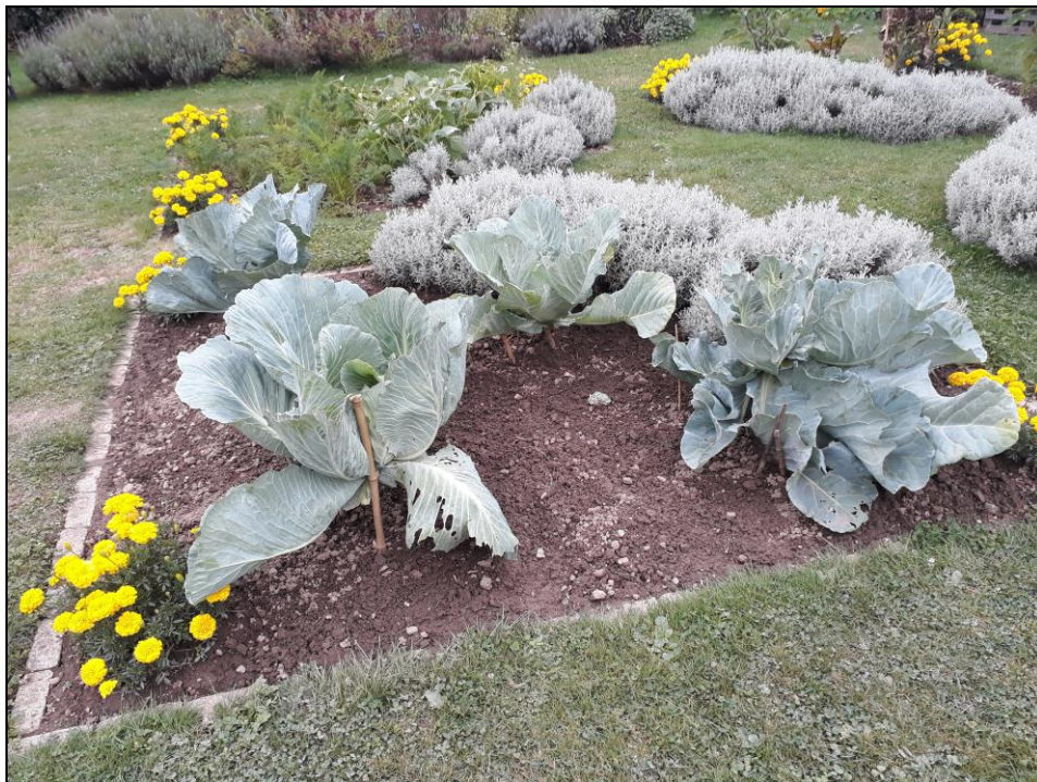
Choux de Magnat

L'aménagement de la chapelle a été terminé en 2017 par la pose de vitraux contemporains figuratifs, inspirés du célèbre cristallier Lalique et œuvre de l'artiste Françoise Bissara-Fréreau et du maître verrier Olivier Juteau. Il existe aujourd'hui en France cinq chapelles ayant utilisé cette technique (Visible en visite guidée).