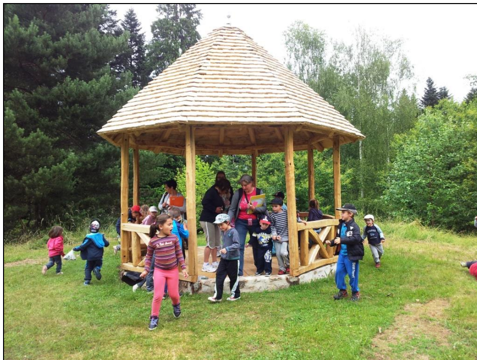
Le kiosque rendez-vous des enfants

Une croupe accidentée mène à une rotonde modelée, point culminant du parc. Le kiosque en châtaignier, travail d'un artisan limousin, y a retrouvé sa place en 2015 pour la plus grande joie des enfants. Un sentier serpente sur la gauche du chemin qui redescend vers la pièce d'eau. Il s'enrichit au fil des ans de nouvelles espèces d'arbustes.